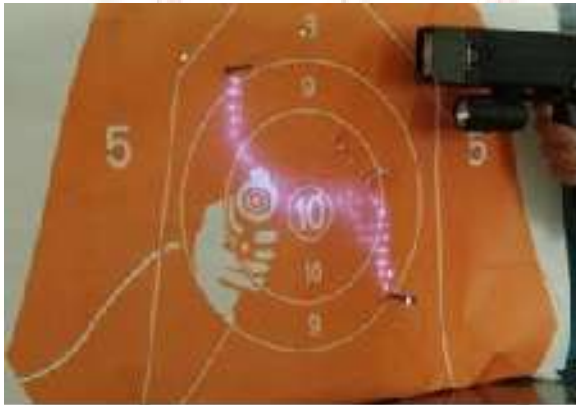
(1). Raysun X-1 DC current (Frequency 0Hz)