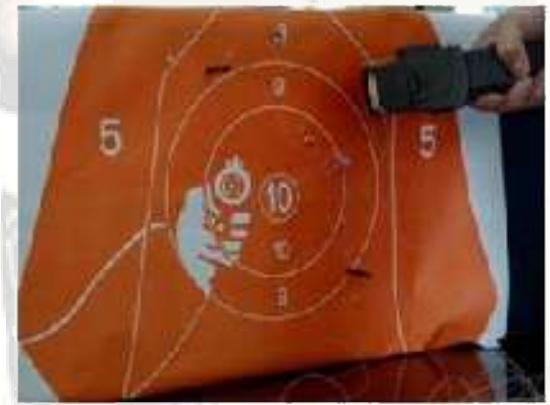
(3). Local stun device + Taser cartridge AC current