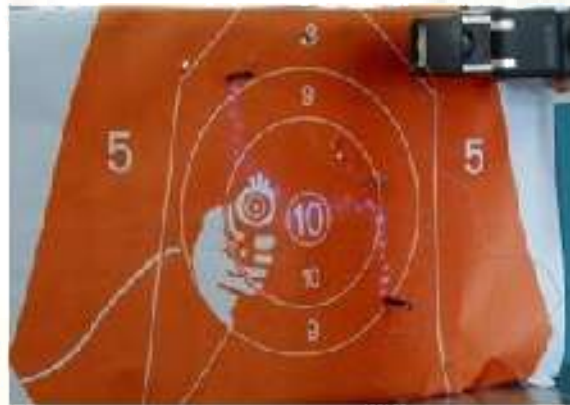
(2). Taser Gun AC current